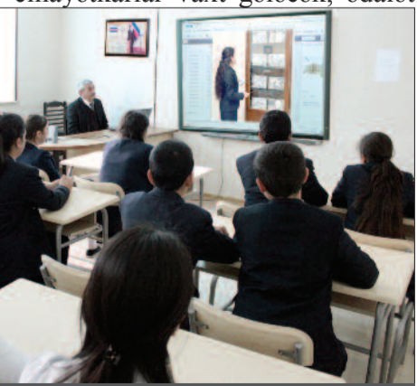
Şahbuz rayon Badamlı kənd tam orta məktəbi

Xocalı sakinləri dünya xalqlarına, dövlətlərinə, beynəlxalq təşkilatlara haqq-ədalət və həqiqəti müdafiə etmək, Xocalıda törədilmiş soyqırımını pisləmək barədə müraciətlər edirlər. Xocalı soyqırımının günahkarları, təşkilatçıları və icraçıları layiqli cəzalarına çatmalıdırlar. Cinayət cəzasız qala bilməz. Təəssüf ki, XX əsrdə soyqırımı və etnik təmizləmə hadisələri baş vermiş tarixi faciələr olub. Xocalı faciəsi onların sırasında ən dəhşətliyinə aiddir. Bu tarixi faciənin iştirakçısı olmuş cinayətkarlar vaxt gələcək, ədalət