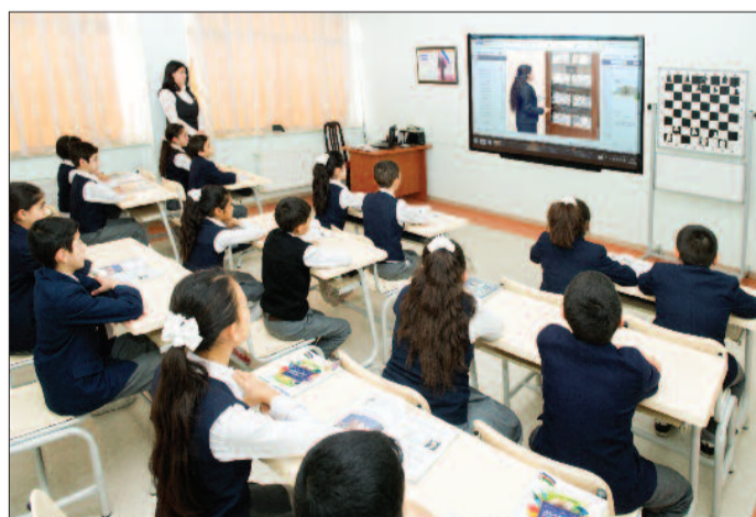
Naxçıvan şəhər 7 nömrəli tam orta məktəb